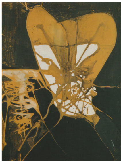
Figura 3. Mário Cesariny, “O Operário”, 1947. Espólio: Fundação Cupertino Miranda. Reproduzido com a autorização da Fundação Cupertino Miranda.

lunetas “de vidro fumados” e dotada de uma dentadura “poderosa, quase brutal”, bem como de antenas “crepusculares”, em permanente vigia. A pintura de O Operário pode mesmo ser vista como esse “negativo”, recorte da figura diáfana do poeta com asas, ou “última prova do laboratório” (Cesariny 1989: 17) desta associação.