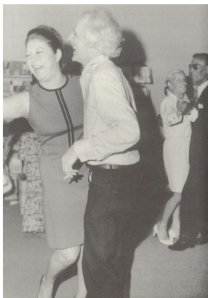
Figura 1. Fotografia do lançamento do livro de Mário Cesariny 19 Projectos de Prémio Aldonso Ortigão seguidos de Poemas de Londres , na livraria Quadrante, em 1971. Em primeiro plano: Natália Correia e Mário Cesariny. Em segundo plano: Henriette Cesariny e Germano.

Nesta passagem afloram três tópicos que se revelam centrais na revisão de conceitos porosos e problemáticos como vanguarda, poesia e performance: 1) a alusão a um metaconhecimento reflexivo sobre o sistema artístico, neste caso, o literário na sua relação com a performance, aqui enunciada por contraposição ao recital oitocentista francês; 2) o facto de se propor como “alavanca crítica” (Carlson 2011: 30) para este mesmo sistema, a performance, a saber, um baile, que pode ser caseiro e cujos requisitos são simples: um disco, que pode ser qualquer outro adereço, e um corpo (Figura 1). Nesta simplicidade aparente reside o terceiro tópico: as entrelinhas de uma atitude combativa, com que este poeta, numa mistura de sonho, ascese e prestidigitação, pontificou por intermédio de palavras mágicas proferidas em tom de poesia, sempre num palco, o da própria vida, e que nunca se cansou de reabilitar.