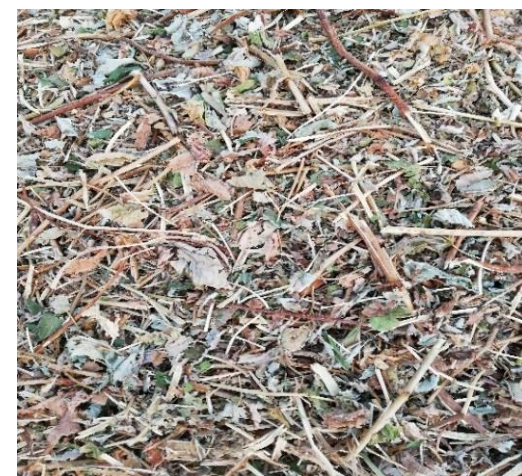
Fig. 4 - Resíduos de canas triturados