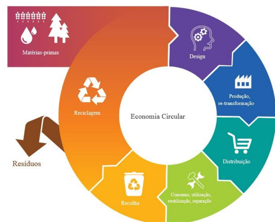
Fig. 1 – Representação esquemática dos princípios da economia circular

O crescimento da área de produção de framboesa em hidroponia no Sul de Portugal tem contribuído para o aumento da quantidade de resíduos resultantes do sistema de produção que se acumulam nas explorações criando um problema de gestão dos resíduos aos agricultores. No entanto, há resíduos agrícolas que apresentam características físicas e químicas que poderão ter interesse em serem usados como fertilizantes, com o intuito de corrigirem organicamente os solos e melhorarem a sua fertilidade.