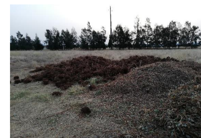
Fig. 3 - Resíduos de substratos de fibra de coco