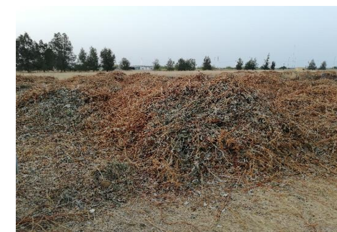
Fig. 2 - Resíduos de canas de framboeseira

Este estudo, com a seleção da cultura de alface de ar livre, teve por objectivo avaliar o efeito da incorporação no solo de diferentes resíduos da cultura da framboesa (i) nas respostas produtivas da alface , concretamente, diâmetro do repolho e peso fresco à colheita, em dois ensaios correspondentes a dois ciclos produtivos, e (ii) na evolução temporal de alguns parâmetros de fertilidade do solo (teor de matéria orgânica, pH, azoto total, fósforo, potássio, ferro, zinco, manganês, cobre).