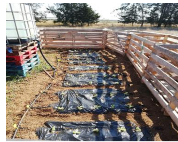
Fig. 6 - Plantação do ensaio 1